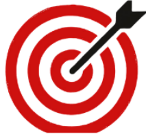
Konzentration & Fokus stärken