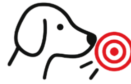
Selbstvertrauen & Erfolgserlebnisse