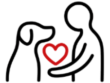
Gemeinsame Bindung stärken